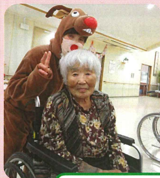
クリスマスランチと ショートケーキ