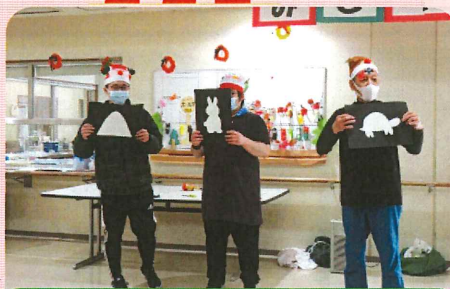
紙切り披露 皆さん、何に見えますか～？