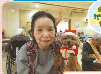
「マロンちゃん」かわいいね(^~^)