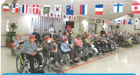
紅組、白組どちらも頑張ってる♪