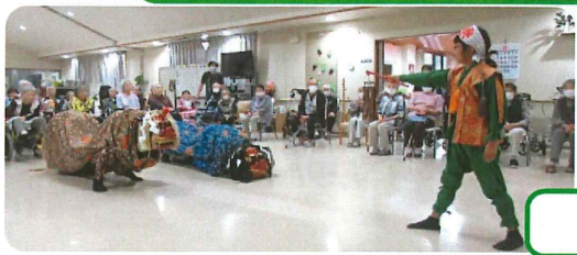
迫力のある獅子舞を間近で見れました。