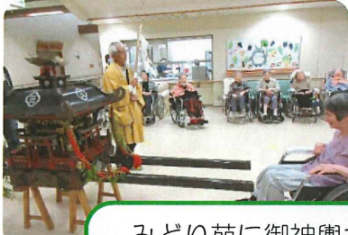
みどり苑に御神輿が来ました。