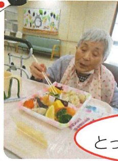
お弁当 とってもおいしいね♪