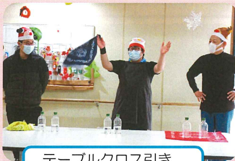
テーブルクロス引き 上手に引けましたよ！