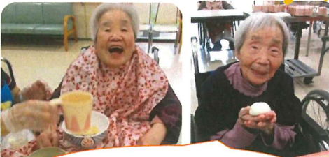
柔らかくて美味しいね♪