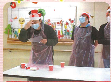
ゆで卵と生卵の確率は？ 当たりを引きました…生卵！