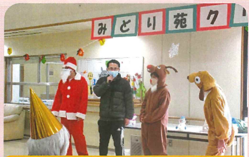
はるばる遠くから来ましたよ♪