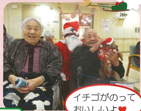
イチゴののって おいしいよ♥