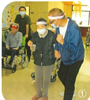
①ヨーイドンの構えで借り物競争です。②麦わら帽子姿の私も素敵でしょう？ ③ひよっとこのお面もいいでしょう？