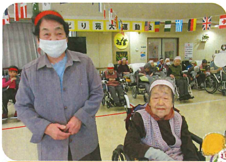
みどり苑運動会 10/13 (金) 大きな声で選手宣誓出来ました。