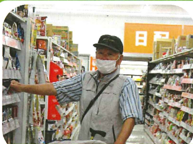
外出行事 (10月・11月) 最近オープンしたお店で久しぶりのお買い物。欲しいものはどこにあるのかなと～探すのも楽しいですね！