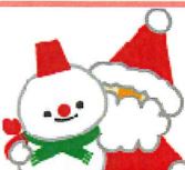
12/22 (金) クリスマス会 サンタさんと一緒に写真を撮りながら神経衰弱やジェスチャーゲームなど、賑やかに楽しみました。