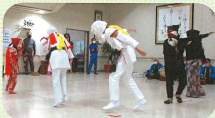
とても素晴らしい演技でした(^)/