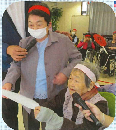
元気よく選手宣誓しました。

赤白に分かれて、お菓子掴みや借り物競争、玉入れなどをしました。いろんな競技に参加してみなさん体を動かし楽しみました。