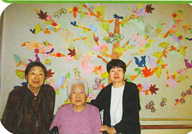
10月壁画 (秋の紅葉) 秋らしい写し絵を作成しました。