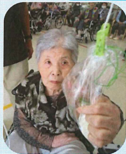
今年は赤組の優勝でした！