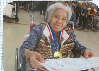
賞状をもらったよ～！