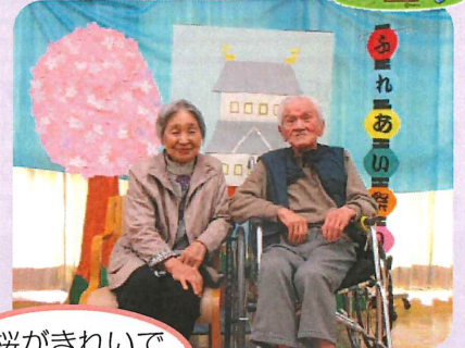
桜がきれい 良いですね♪