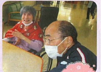
お久しぶりです！ 元気だったかな？