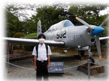
知覧特攻平和会館

「百聞は一見に如かず」の言葉の通り、この旅行での体験は、大きな学びとなるだけでなく、中学校生活の大切な思い出となったことでしょう。今後の学校生活で、この学びと思い出をしっかりと生かしてほしいと思います。