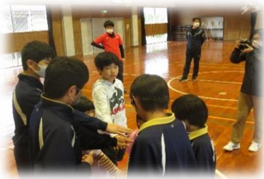
4月28日(水) 江島小中学校 合同歓迎遠足

新型コロナウイルス感染拡大により対応が難しい中、他校からの協力を得て、交流学習を進めてきました。子どもたちは、多人数の集団に入っていくことにプレッシャーを感じながらも、それを乗り越え、大きく成長しています。「違う空気」に触れる経験は、子どもたちの未来にとって、本当に必要な力であると感じています。今後も感染症対策に万全の注意を払いながら進めていきたいと思ひます。