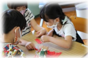
6月8日(火) 崎戸小学校 小2・3交流学習