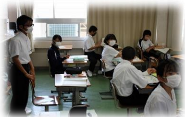
6月14日(月) 大崎中学校 中1・3交流学習

※ 大島東小学校とは、PCを使つての「遠隔授業」や、水泳指導後の「交流学習」を予定しています。